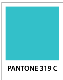
PANTONE 319 C