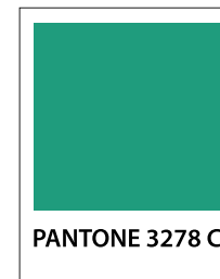
PANTONE 3278 C

C: 81 % R: 7 M: 15 % G: 151 Y: 63 % B: 119 K: 2 %