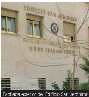
Fachada exterior del Edificio San Jerónimo

Líneas: Acceso al Campus Centro: líneas N1, N3, N9, SN1, U2, U3, C6 y LAC.