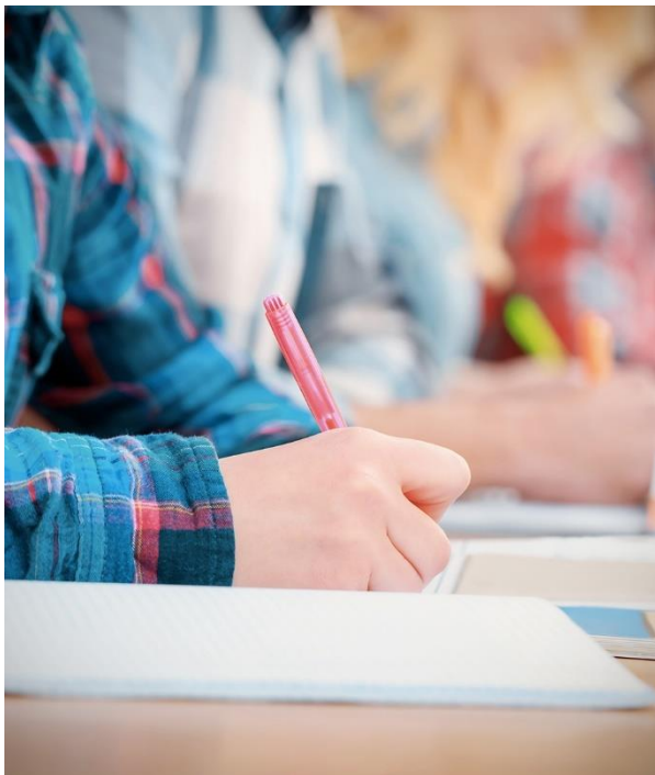
Calendario de Exámenes de la convocatoria especial de noviembre