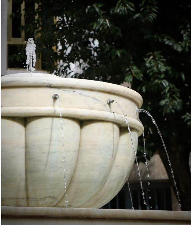
Corte suministro de agua potable